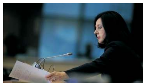
Věra Jourová