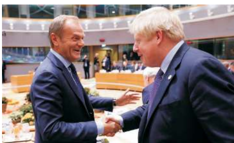
Donald Tusk a Boris Johnson

Lídři zemí Evropské unie 17. října podpořili uzavřenou dohodu o britském odchodu ze společenství. Prezidenti a premiéři v přijatých závěrech rovněž schválili politickou deklaraci o budoucích vztazích Británie a EU.