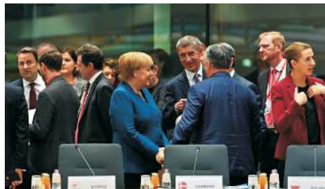
Lídři zemí EU na summitu ER

Tureckou invazí do Sýrie odsoudila jako porušení mezinárodního práva i Poslanecká sněmovna ČR. 14. října Česko pozastavilo vývozní licence na vojenský materiál do Turecka, ministr zahraničí