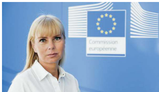
Komisařka Elzbieta Bienkowska

Při příležitosti debaty s občany na téma přínosů a výzev členství v Evropské unii, konané 8. října v Olomouci, poskytla eurokomisařka Elzbieta Bienkowská exkluzivní rozhovor pro portál Euroskop. Hovořila o nejdůležitějších aspektech jejího portfolia – o pravidlech vnitřního trhu, evropských vesmírných programech, podpoře společných vojenských akvizic i o malých a středních podnicích.