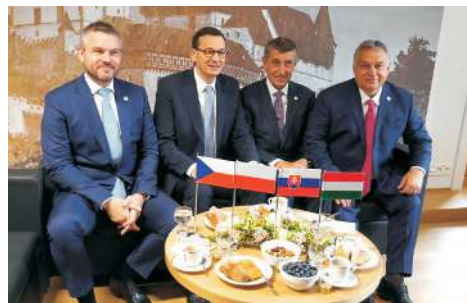
Premiéři zemí V4

Prezidenti a premiéři zemí Evropské unie se ani během dlouhého nočního jednání neshodli na zahájení přístupových rozhovorů s Albánií a Severní Makedonií. Novinářům to řekl finský premiér Antti Rinne, podle něhož budou sporné téma řešit i na ranním pokračování rozhovorů.