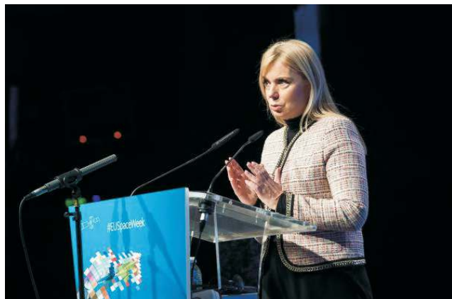
Komisařka Elżbieta Bienkowska

neefektivním výdajům na obranu. A v oblasti vesmíru jsme poprvé navrhli vytvořit vesmírný program Evropské unie, a to zahrnutím veškerých unijních aktivit v oblasti vesmíru pod jednu střechu. Toto představuje skutečné historické počiny a jsem hrdá na to, že na nich mám svůj podíl.