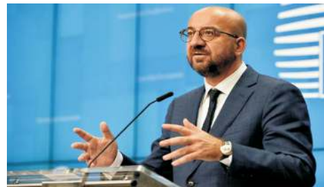
Předseda Evropské rady Charles Michel

Rámcové úmluvy o kontrole tabáku. Ta byla sjednaná pod záštitou Světové zdravotnické organizace a se 168 signatáři vstoupila v platnost v roce 2005.