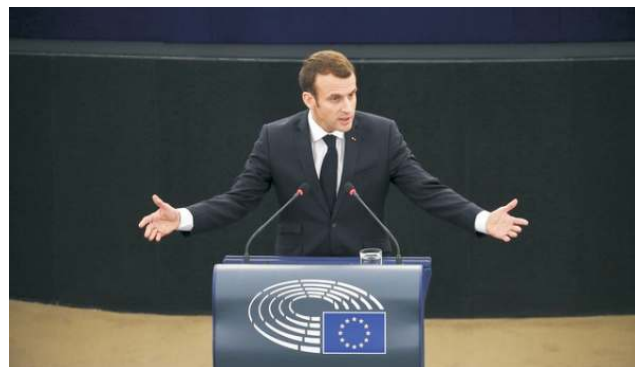
Francouzský prezident Emmanuel Macron

Po útocích provedly francouzské autority desítky bezpečnostních akcí. Uzavřely mešity a několik sdružení, která podle nich mají vazby na radikální islám. Zatkly několik desítek lidí a oznámily plány na vyhoštění 231 cizinců, z nichž většina je již ve vězení. Francie rovněž usiluje o zpřísnění opatření v celé Evropské unii proti nenávisným projevům online. Zároveň podporuje legislativní snahu EU o odstranění teroristického obsahu ze sociálních sítí.