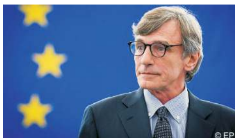
Předseda EP David-Maria Sassoli

Státy Evropské unie se po více než dvouměsíčním vyjednávání dohodly s Evropským parlamentem na parametrech budoucího sedmiletého rozpočtu a fondu pomoci ekonomikám zasaženým koronavirovou krizí.