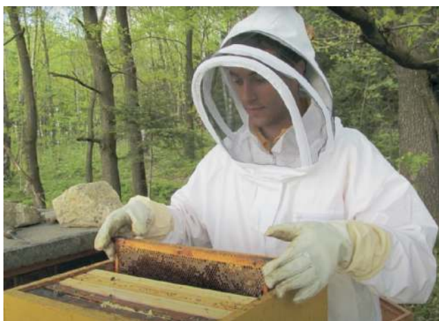
Dobrovolníky čekala řada nečekaných aktivit, třeba práce se včelami.

Kdy jsem měla pocit, že je to skvělé, to bylo ve chvíli, kdy se k nám začali dobrovolníci vracet. Obrovský pocit zadostiučinění. Máme dobrovolníky, s kterými jsme v kontaktu téměř denně. Poslat si fotku nebo vyměnit pár řádků, to je díky dnešním technologiím velmi snadné.