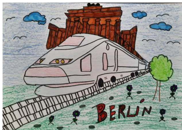
Speciální ocenění (kat. 2. stupeň): Tereza M., ZŠ praktická Dlažkovice