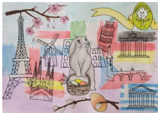
2. místo (kategorie B), Jana B., 13. ZŠ Plzeň

Výsledky velikonoční výtvarné soutěže "Se zajičkem po Evropě", kterou vyhlášovalo Eurocentrum Plzeň spolu s Eurocentrem České Budějovice a Europe Direct České Budějovice, jsou tu!