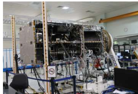
Družice Sentinel-1C v poslední fázi testování.

Agentura ESA uzavřela jménem Evropské komise smlouvu s firmou Arianespace na vynesení družice Sentinel-1C programu Copernicus na oběžnou dráhu. Copernicus je program pro dálkový průzkum Země koordinovaný a řízený Evropskou unií, konkrétně Evropskou komisí, ve spolupráci s agenturou ESA. Zaměřuje se na pozorování atmosféry, pevniny, moří a klimatu. Je využíván i v oblasti bezpečnost a poskytuje podporu záchranným operacím v případě katastrof a havárií. Družice Sentinel-1C bude na oběžnou dráhu vynesena v první polovině roku 2023 evropskou raketou Vega-C z kosmodromu Kourou ve Francouzské Guyaně.