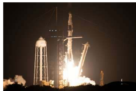
Start rakety Falcon 9, jež k Mezinárodní vesmírné stanici vynesla vesmírnou loď Crew Dragon s posádkou Crew-4.

Čtyři astronauti, společně známí jako Crew-4, odletěli ve středu 27. dubna 09:52 SELČ z Kennedyho vesmírného střediska NASA na Floridě v USA a stráví ve vesmíru téměř půl roku. Na Mezinárodní vesmírnou stanici posádku přepravila vesmírná loď Crew Dragon společnosti SpaceX po zhruba 16 hodinách letu.