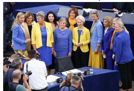
Evropské komisařky a předsedkyně Komise Ursula von der Leyenová vítaly Olenu Zelenskou v ukrajinských barvách

Letošní projev nestál pouze na úspěších Evropské unie, nýbrž reflektoval i jistá pochybení. „Jedním z ponaučení, které si bereme z této války, je to, že jsme měli naslouchat těm, kdo Putina znají,” uvedla von der Leyenová a konkrétně zmínila například ruskou novinářku Annu Politkovskou či běloruskou opozici.