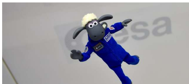
Ovečka Shaun ve stavu beztíže. Zdroj: ESA/Aardman.

Evropská vesmírná agentura jmenovala prvním astronautem, který se zúčastní letu na Měsíc v rámci programu Artemis, ovečku Shaun, známou z britského kresleného seriálu. Evropská vesmírná agentura zajišťuje mj. servisní modul vesmírné lodi Orion, která bude 29. srpna 2022 do vesmíru vynesena raketou SLS (Space Launch System) z Kennedyho vesmírného střediska na Floridě.