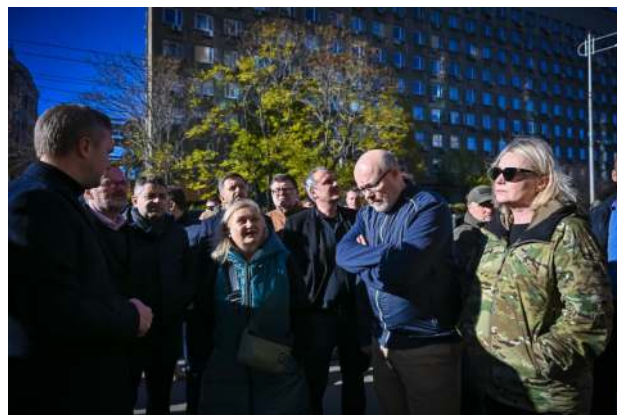
Návštěvu zahájili členové vlády v čele s premiérem zastávkou u historického domu, který se před dvěma týdny stal cílem ruského ostřelování.

Centrem těchto snah je Praha, kde sídlí Agentura EU pro vesmírný program (EUSPA). Spolu s agenturou EUSPA zajišťuje provoz evropských vesmírných programů Evropská kosmická agentura (ESA) – mezinárodní organizace, která