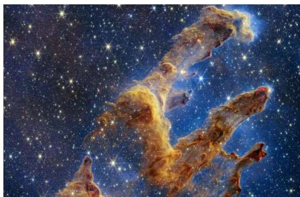
Pilíře stvoření nasnímané kamerou NIRCcam teleskopu Jamese Webba. Zdroj: NASA, ESA, CSA, STScI; J. DePasquale, A. Koekemoer, A. Pagan (STScI).

Vesmírný dalekohled Jamese Webba zachytil na velmi detailním snímku ikonický objekt – tzv. Pilíře stvoření – oblast, kde se v hustých oblacích plynu a prachu formují nové hvězdy. Trojrozměrné pilíře vypadají jako majestátní skalní útvary, ale ve skutečnosti jsou tvořeny chladným mezihvězdným plynem a prachem. Když se v těchto pilířích plynu a prachu vytvoří uzly s dostatečnou hmotností, začnou se hroutit pod vlastní gravitací, pomalu se zahřívají a nakonec vytvoří nové hvězdy. Tyto nově vzniklé protohvězdy jsou na snímku z kamery NIRCcam (Near Infrared Camera) Webbova teleskopu mimořádně dobře vidět.