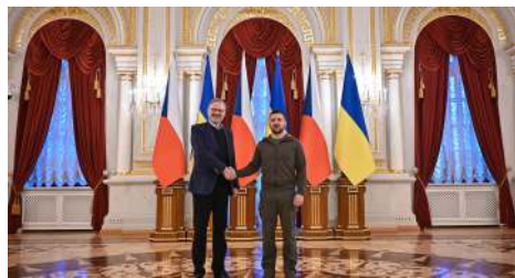
Český premiér Petr Fiala a ukrajinský prezident Volodymyr Zelenskyy na jednání v Kyjevě

Česká delegace v čele s Petrem Fialou jednala v Kyjevě s ukrajinskou vládou a prezidentem Volodymyrem Zelenskym. Členové obou kabinetů jednali především o poválečné obnově Ukrajiny a o tom, jak se na ní mohou podílet české podniky. Cesta měla také vyjádřit jasnou podporu Ukrajině a podpořit ukrajinské ambice vstoupit do Evropské unie a Severoatlantické aliance. Jednání se stalo v pořadí desátým zasedání české vlády v zahraničí.