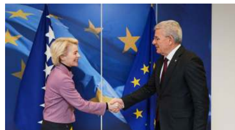
Dne 30. března 2022 přijala předsedkyně Evropské komise Ursula von der Leyenová Vysokého představitele pro Bosnu a Hercegovinu Šefika Džaferovićová

Kromě 14 priorit nyní Komise v nejnovějším balíčku předkládá osm dalších kroků, které má Bosna přijmout. Ty se zaměřují především na reformu soudnictví, předcházení střetu zájmů, boj proti korupci a organizovanému zločinu, správu hranic a migraci, svobodu sdělovacích