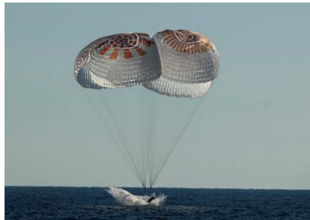
Přistání kosmické lodi Crew Dragon Freedom v Atlantském oceánu u pobřeží Floridy.

Samantha Cristoforetti a její kolegové, společně známí jako Crew-4, se vrátili na palubě kosmické lodi Crew Dragon Freedom společnosti SpaceX, která se od stanice autonomně odpojila 14. října 2022 v 18:05 SELČ a ve 22:55 SELČ přistála v Atlantském oceánu u pobřeží Floridy. Na Mezinárodní vesmírné stanici strávila posádka Crew-4 více než 170 dní.