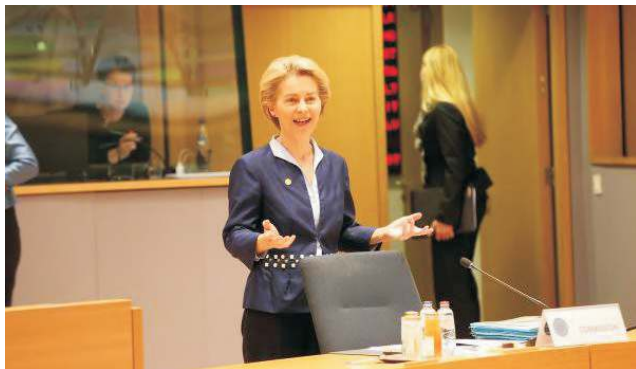
Předsdkyně Komise Ursula von der Leyenová

toto úsilí se spojí v evropském klimatickém paktu, ke kterému se budou moci vyjadřovat regiony, místní společenství, občanská společnost, školy, zástupci průmyslu i jednotlivci. EU povede rovněž mezinárodní jednání před konferencí COP26 v Glasgow. Komise předloží podněty k řešení ztráty biologické rozmanitosti a prostřednictvím strategie „od zemědělce ke spotřebiteli“ podpoří zemědělce, aby udržitelnějším způsobem dodávali vysoce kvalitní, cenově dostupné a bezpečné potraviny.