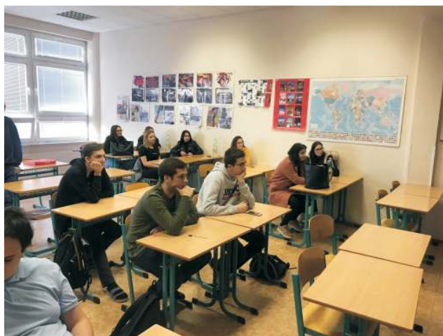
Autor: Nikola Pavlůsková, Eurocentrum Brno

Chcete se o EU taky něco dovědět? Napište nám a třeba bude příští přednáška právě u vás!